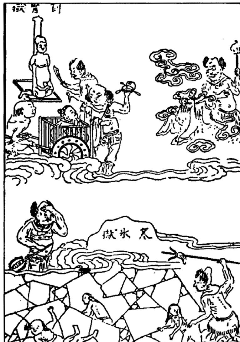
Phạm tội loạn luân, bị cắt thận. Làm quan tính kẻ đảo điên, ăn hối lộ, bị nhốt trong hỏa xa. Đem vắng toan mưu dối, bị cát mây đen dè mình. Xúi trửê thơ lâm lỗi, bị cầm trong ngục giá lạnh.

Vua Sở Giang coi Đẳng Huyệt Đại Địa Ngục