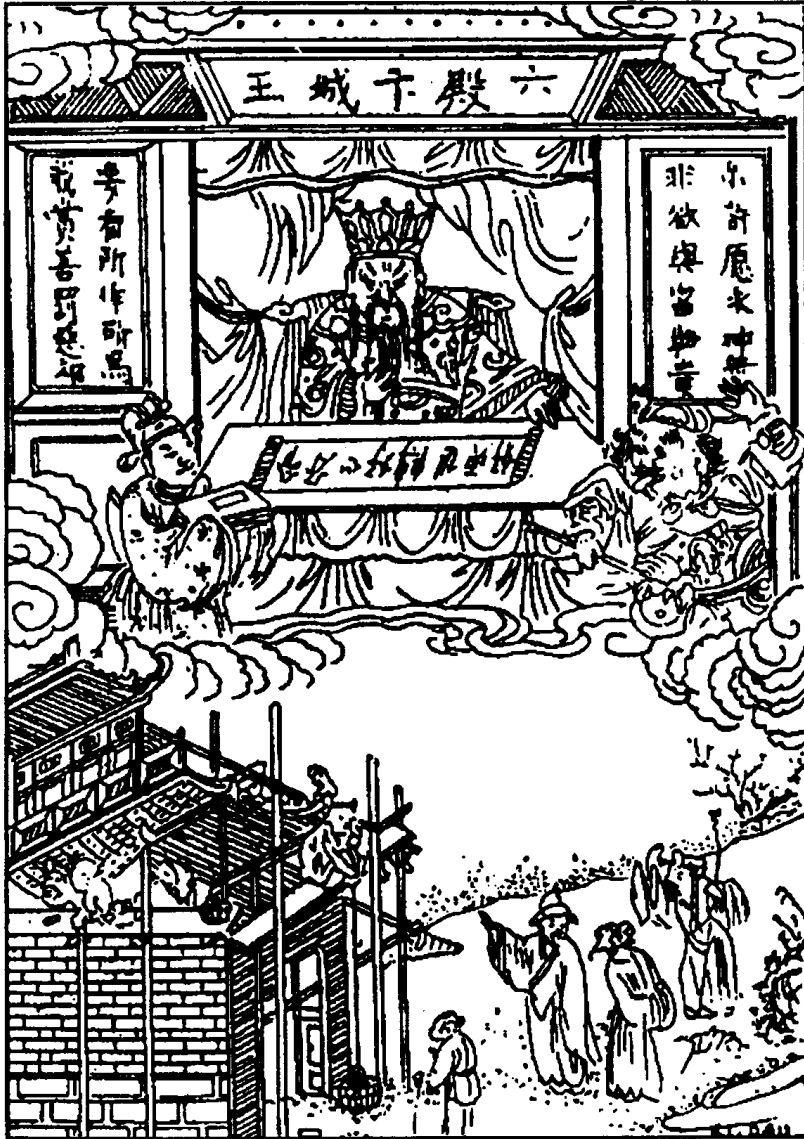
Cất chùa, sửa am thì đặng phước.

Vua Biện Thành coi Đại Kiều Hoán Đại Địa Ngục