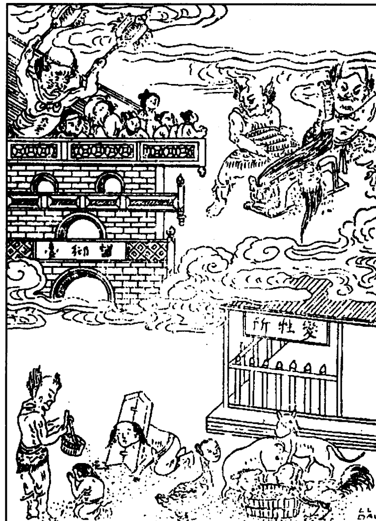
Tội nhiều, lên Đài Vọng Hương ngó về nhà cửa quê hương, hoặc thấy việc buồn rầu, hoặc xem qua cảnh tượng thì tức tối mà khóc than thâm thiết. Hủy hoại lúa gạo, cơm cháo, bị ăn giòi tửa dơ dáy. Con bắt hiểu bị chặt, bằm v.v...