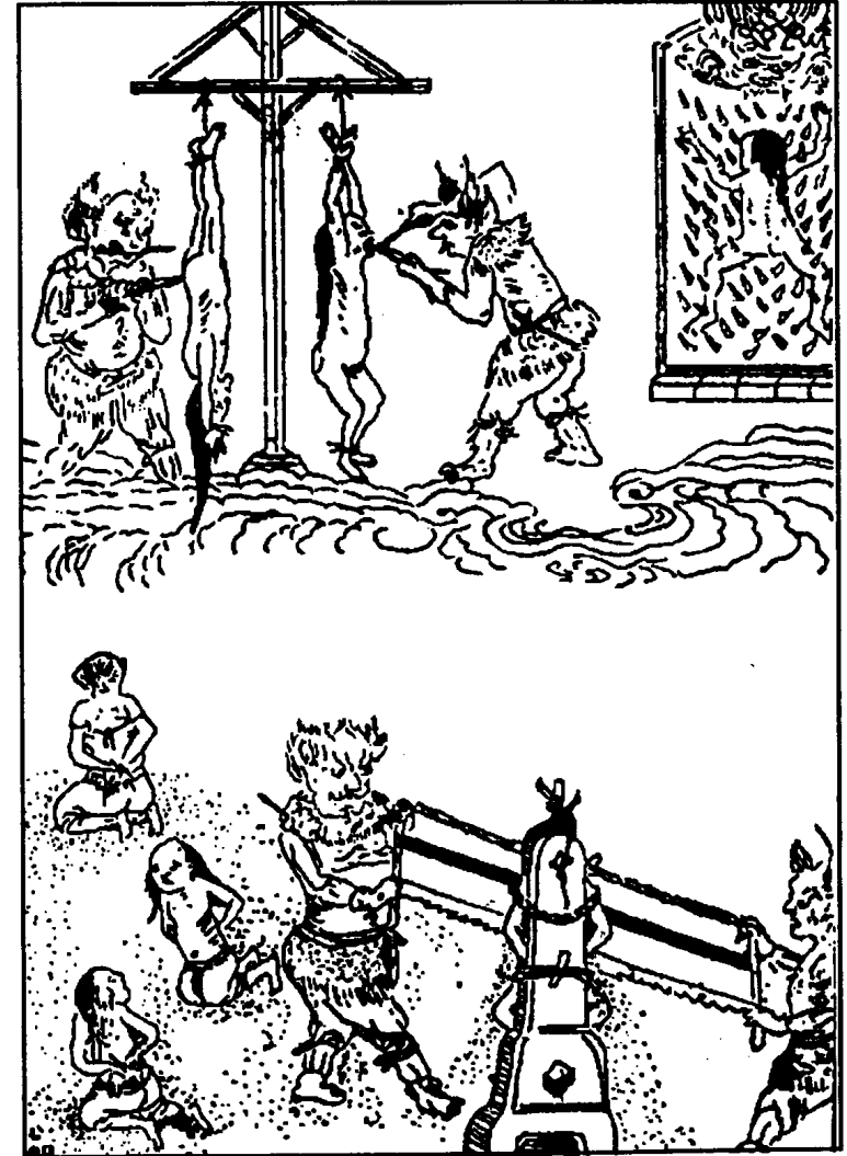
Bể vựa chờ lúa giá cao mà bán để cho người nghèo chịu đói (bể địch trợ hoang), hoặc là gian xảo ngược ngang, bị hành bản chông nhọn. Chười gió mắng mưa, kêu tên Thần Thánh chẳng chút kiêng vì, bị cột trời ngược mà cửa xẻ, cắt lưỡi.

Vua Biện Thành coi Đại Kiều Hoán Đại Địa Ngục