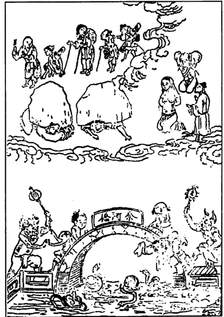
Không kính giấy chữ, rủ nhau ăn thịt trâu chó, phạt làm ăn mày. Không kính người lớn, chẳng vâng lời phải, hoặc thầy không bảo học trò trọng giấy chữ, đều bị đá dè. Nói ra nói vô, xúi người kiện cáo, bị xô xuống Cầu Nại Hà cho rắn cua ăn thịt.