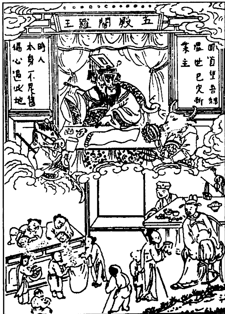
Nhiều năm bố thí cho người nghèo dân đói thì đặng phước.