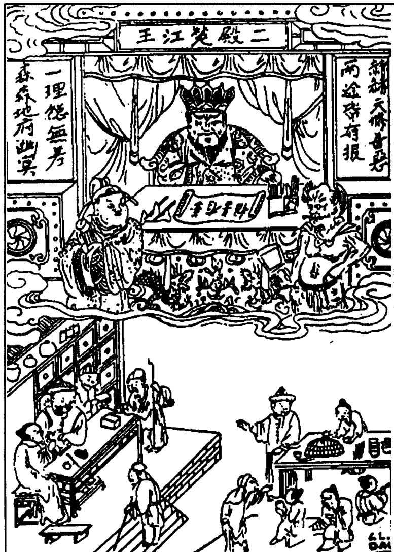
Thí tiên, thí thuốc, thí cơm cháo thì đặng phước.

Vua Sở Giang coi Đẳng Huyệt Đại Địa Ngục