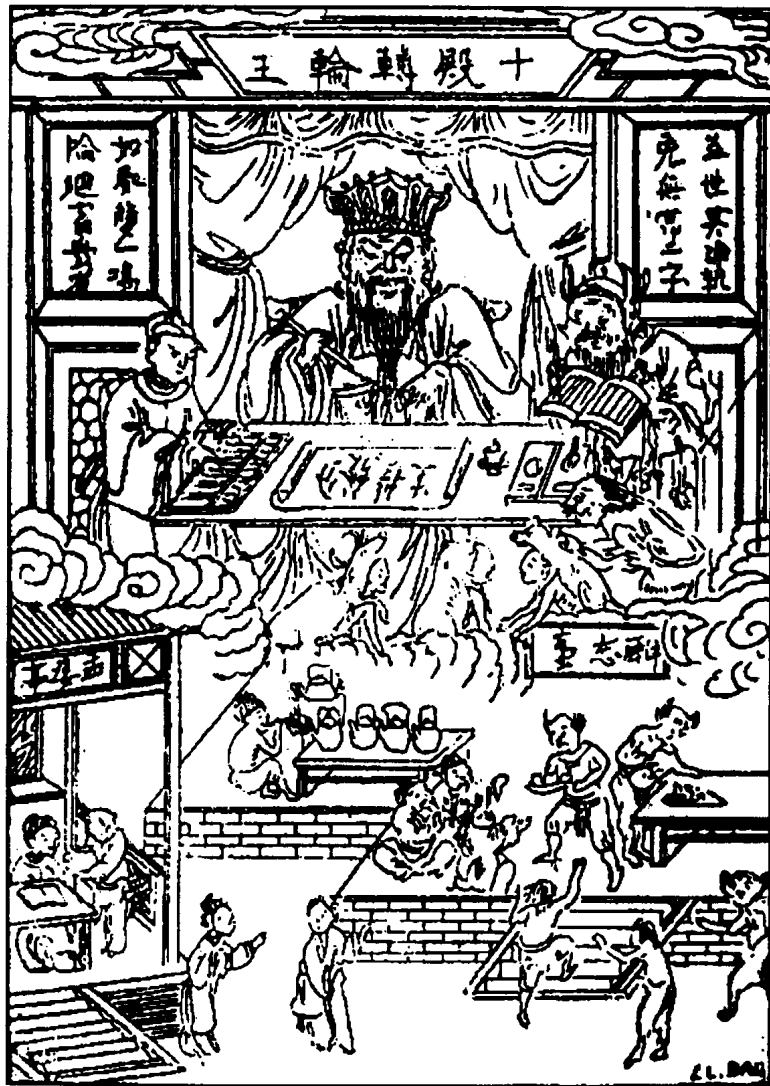
Tụng kinh, niệm Phật và vâng giữ y lời thì đặng phước lớn.