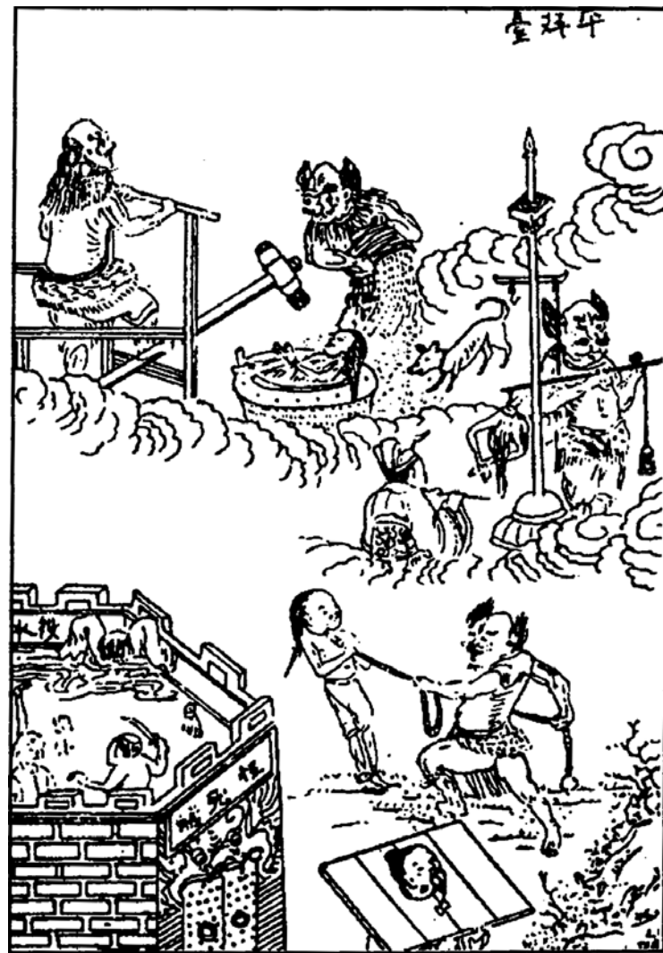
Đo gian dong thiếu, lường cân tráo dẫu, bị cối đập đồng giã dần cho chó ăn, hoặc bị móc treo mình nhông nhảnh. Tự vận chẳng màng ngay thảo, hồn oan bị cầm nơi Thành Uổng Tử, dọa dầy hành mãi cho đến đúng số mới đặng luân hồi. Cho vay ăn lời quá vốn, phạt mang gông cùm.

Vua Ngũ Quan coi Chúng Hiệp Đại Địa Ngục